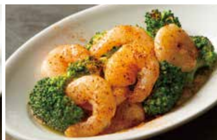
✓ SHRIMP & BROCCOLI w/ CHILI MAYO SALAD 750 海老とブロッコリーのチリマヨサラダ