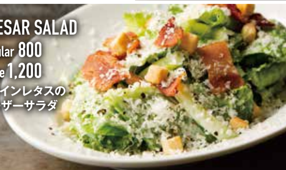
CAESAR SALAD Regular 800 Large 1,200 ロメインレタスの シーザーサラダ