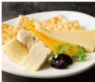
ASSORTED CHEESE 900 チーズ盛り合わせ