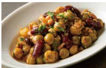
✓ SPICY MARINATED 3 KINDS OF BEANS 700 3種豆のスパイシーマリネ