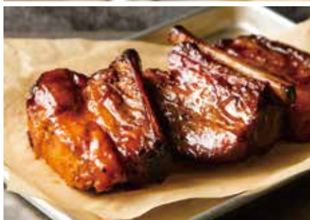
BBQ PORK SPARE RIB 1pc 700/2pcs 1,350/3pcs 1,950 BBQポークスペアリブ