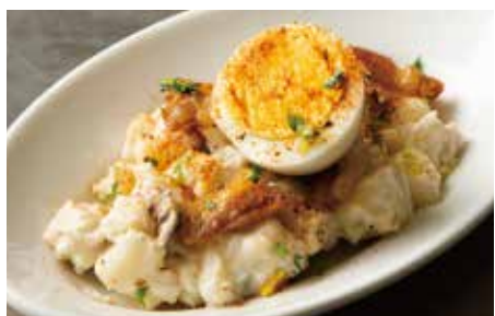
✓ RUSSIAN POTATO SALAD 650 ロシア風ポテトサラダ