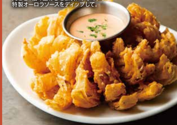
CHEESE NACHOS 850 チーズナチョス