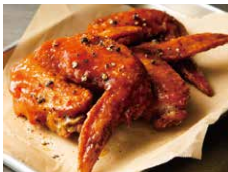
RED HOT CHICKEN 850 レッドホットチキン