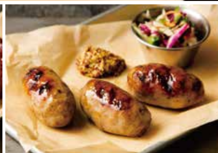
GRILLED SAUSAGE 850 粗挽き生ソーセージグリル