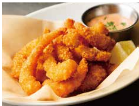
POPCORN SHRIMP 900 ポップコーンシュリンプ