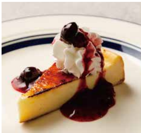
BAKED CHEESECAKE w/ BERRY SAUCE 800