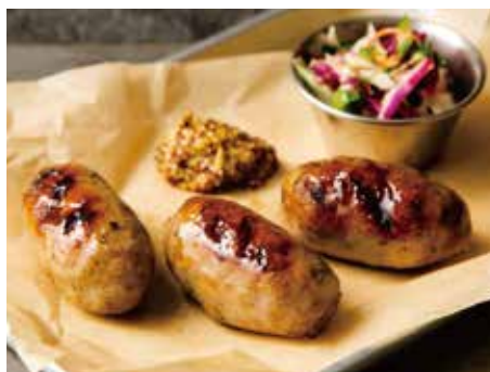
GRILLED SAUSAGE 850 粗挽き生ソーセージグリル