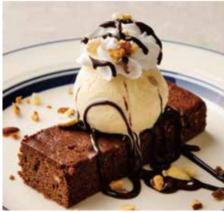
CHOCOLATE BROWNIES w/ VANILLA ICE CREAM & CHOCOLATE SAUCE 850