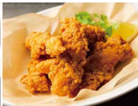
CRISPY FRIED CHICKEN 850 クリスピーフライドチキン