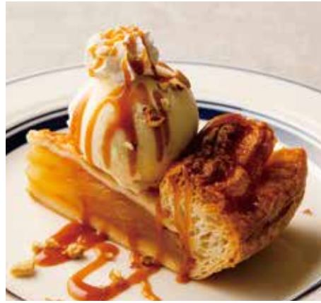
APPLE PIE w/ VANILLA ICE CREAM & CARAMEL SAUCE 850