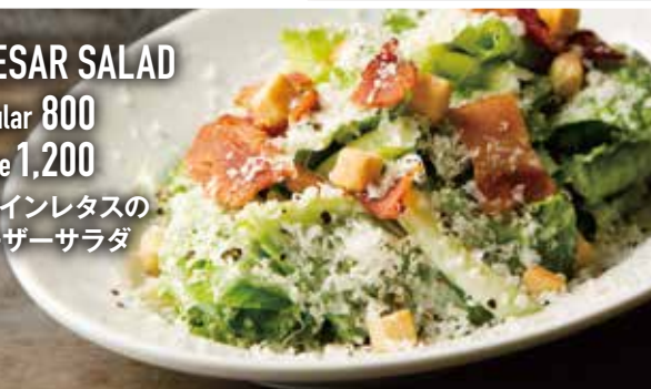
CAESAR SALAD Regular 800 Large 1,200 ロメインレタスの シーザーサラダ