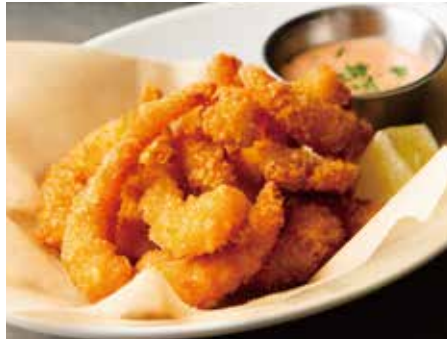
POPCORN SHRIMP 950 ポップコーンシュリンプ