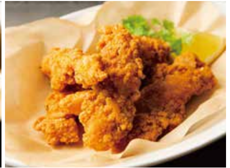
CRISPY FRIED CHICKEN 850 クリスピーフライドチキン