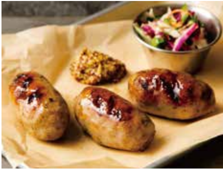
GRILLED SAUSAGE 850 粗挽き生ソーセージグリル