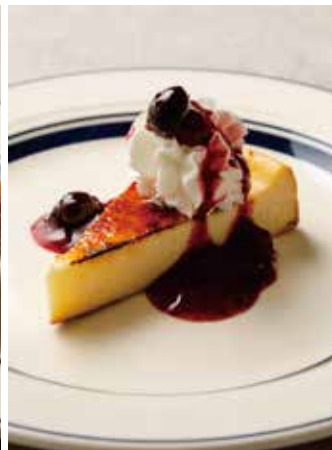
BAKED CHEESECAKE w/ BERRY SAUCE 800 バイクドチーズケーキ