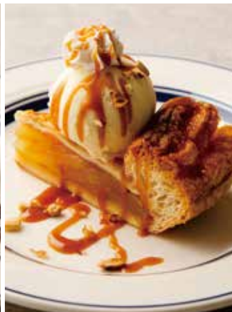
APPLE PIE w/VANILLA ICE CREAM & CARAMEL SAUCE 850 アップルパイ