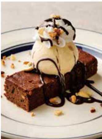
CHOCOLATE BROWNIES w/VANILLA ICE CREAM & CHOCOLATE SAUCE 850 チョコレートブラウニー