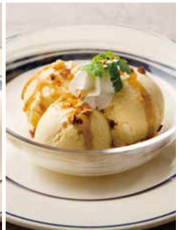
VANILLA ICE CREAM 600 バニラアイスクリーム