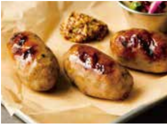
GRILLED SAUSAGE 850 粗挽き生ソーセージグリル