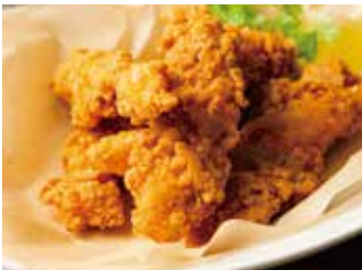
CRISPY CHICKEN 850 クリスピーフライドチキン