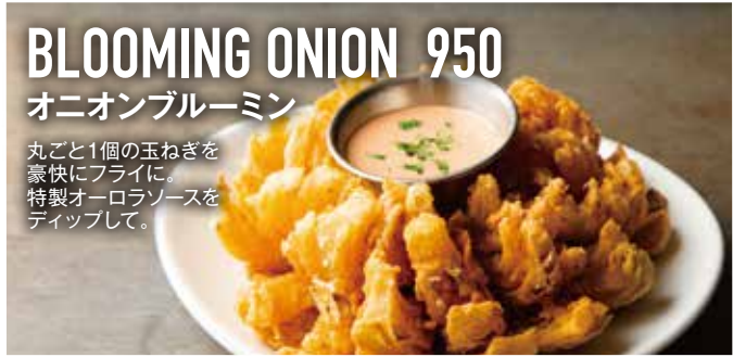
BLOOMING ONION 950 オニオンブルーミン