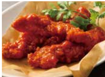
RED HOT CHICKEN 950 レッドホットチキン

FRENCH FRIES 700 w/CHILI MAYO GARLIC MAYO フレンチフライ チリマヨネーズ ガーリックマヨネーズ付き