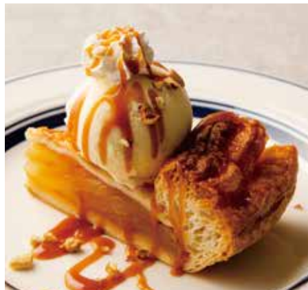
APPLE PIE w/ VANILLA ICE CREAM & CARAMEL SAUCE 850