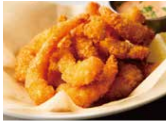
POPCORN SHRIMP 950 ポップコーンシュリンプ