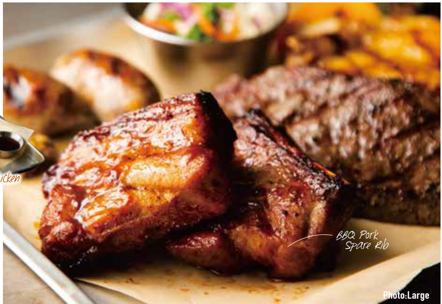
BBQ Pork Spare Rib

with 1 Side Dish & Grilled Vegetables 4種BBQ コンボ サイドディッシュ1種 & グリル野菜付き