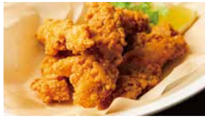
CRISPY CHICKEN 850 クリスピーフライドチキン