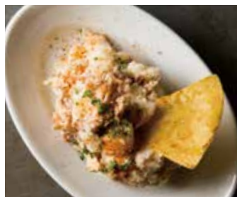
POTATO SALAD 650 ポテトサラダ