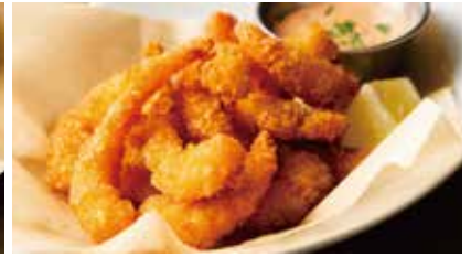
POPCORN SHRIMP 950 ポップコーンシュリンプ