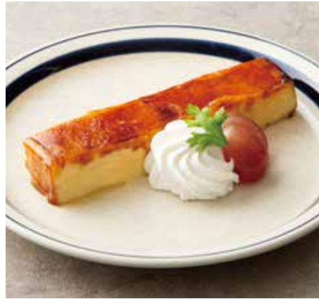
CREMA CATALANA 850 クレマカタラーナ