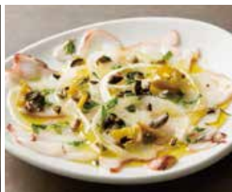
OCTOPUS CARPACCIO 1,200 水だこのカルパッチョ