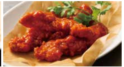
RED HOT CHICKEN 950 レッドホットチキン

FRENCH FRIES 700 w/CHILI MAYO GARLIC MAYO フレンチフライ チリマヨネーズ ガーリックマヨネーズ付き