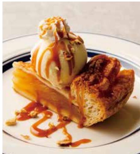
APPLE PIE w/ VANILLA ICE CREAM & CARAMEL SAUCE 850 アップルパイ バニラアイスクリームとキャラメルソース