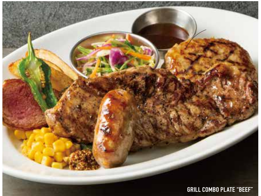
GRILL COMBO PLATE "BEEF"