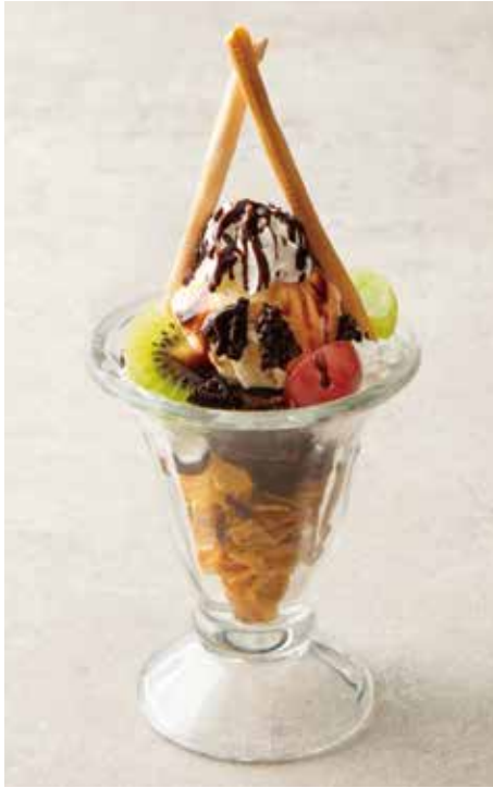
CHOCOLATE SUNDAE 990 チョコレートサンデー