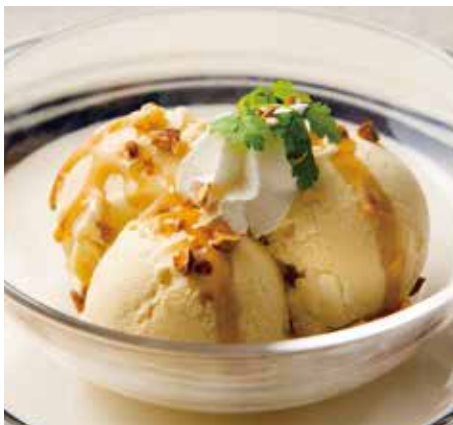
VANILLA ICE CREAM w/ CARAMEL SAUCE 600 バニラアイスクリーム キャラメルソース

For information about the production area of rice, please kindly ask one of our staff members. <For customers with food allergies> ①Please feel free to ask a member of staff for allergens. ②Shrimps and crabs may be contained in the seafood ingredients we use at our restaurant. ③Tolerance against allergen varies among individuals. Since our preparation and cooking process involves shared cookware and dishwasher, please be extra cautious if you react to a slight amount of allergen.