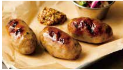
GRILLED SAUSAGE 850 粗挽き生ソーセージグリル