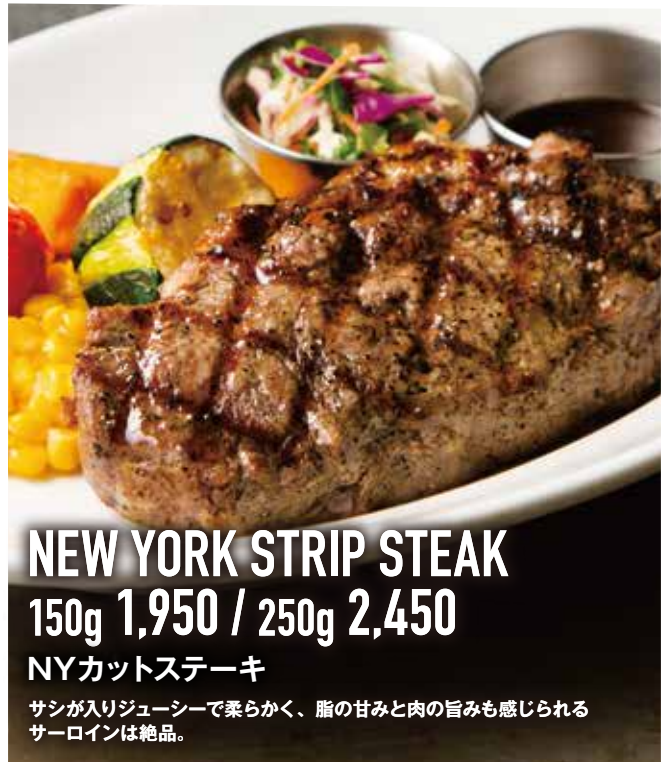
NEW YORK STRIP STEAK 150g 1,950 / 250g 2,450 NYカットステーキ

柔らかく、しっかりと感じられる甘い脂が絶品。まずはそのまま、素材の味をご堪能ください。お好みでステーキソースでどうぞ。