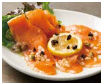
MARINATED SMOKED TROUT SALMON 1,150 スモークトラウトサーモンのマリネ