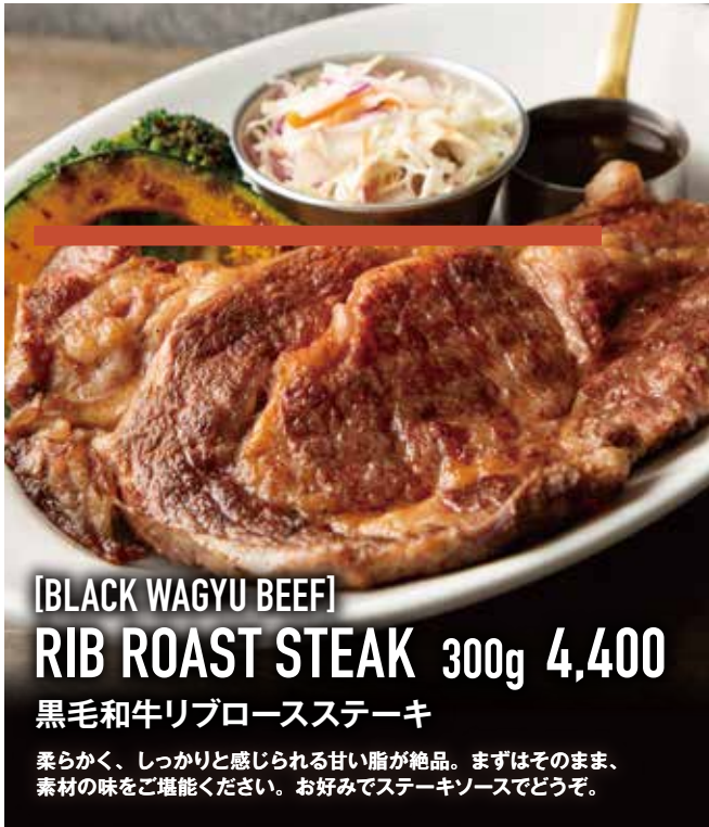
[BLACK WAGYU BEEF] RIB ROAST STEAK 300g 4,400 黒毛和牛リブロースステーキ

柔らかく、しっかりと感じられる甘い脂が絶品。まずはそのまま、素材の味をご堪能ください。お好みでステーキソースでどうぞ。