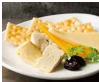
ASSORTED CHEESE 1,150 チーズ盛り合わせ